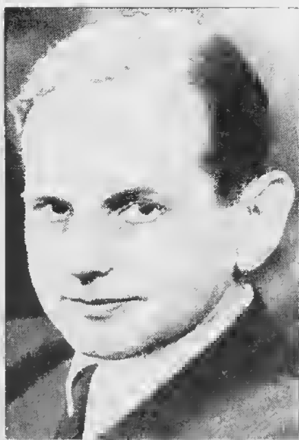
Otto Ohlendorf, Leiter der Einsatzgruppe D

Die als Anklagebeweisstücke vorgelegten Berichte wurden von dem Referat IV A 1 -- Kommunismus, Kriegsverbrechen und Feindpropaganda -- des Amtes IV im RSHA in Berlin hergestellt. Referat IV A 1 war bis etwa Ende April 1942 die Sammel- und Auswertungsstelle aller Meldungen und Berichte der in Rußland tätigen Einsatzgruppen. Die beim RSHA einlaufenden Originalberichte wurden in fast täglicher Berichterstattung -- nahezu 200 Exemplare von Juli 1941 bis April 1942 --