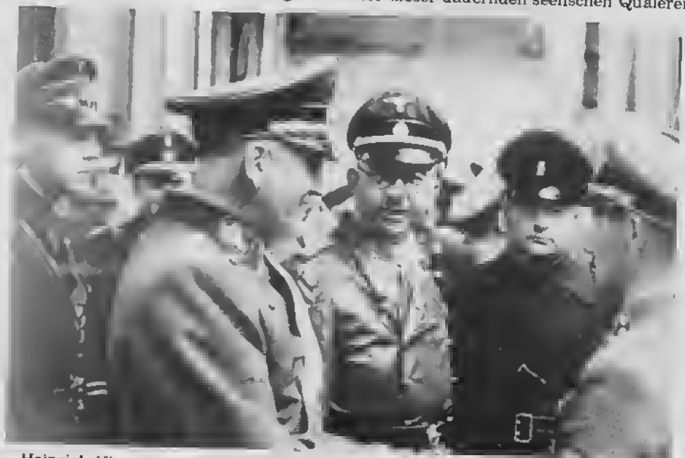
Heinrich Himmler im Gespräch mit Oswald Pohl und dem holländischen Führer der Nationaal Socialistischen Beweging (NSB), Anton A. Mussert