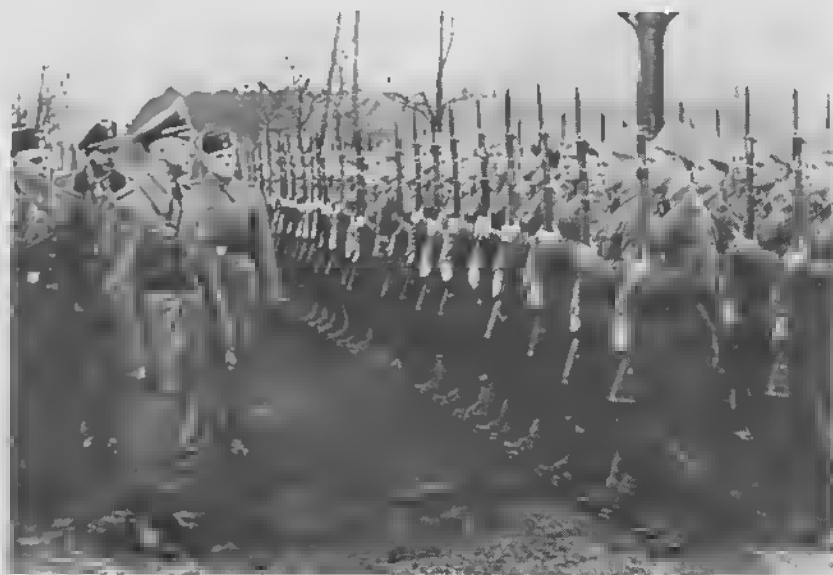
Himmler besucht 1943 Soldaten der Waffen-SS Gebirgs-Division "Handschar" (Kroaten)