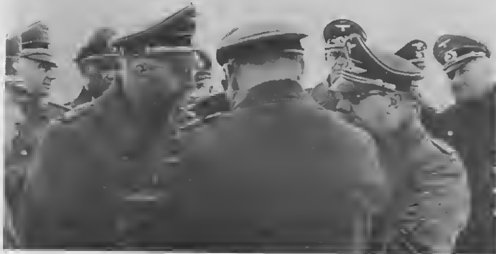
Der RF-SS im Gespräch mit höheren Luftwaffen-, Heeres- und Polizeioffizieren in Minsk 1942. Meinungsverschiedenheiten sind nicht erkennbar.

» 3 « "Wenn ein Ritterkreuzträger fällt,"